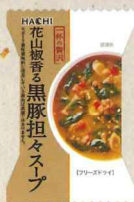
一杯の贅沢 花山椒香る 黒豚担々スープ