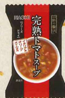
一杯の贅沢 完熟トマトスープ イタリア産 オリーブオイル使用