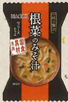
一杯の贅沢 根菜のみそ汁