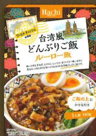
ワールドディッシュ 台湾風どんぶりご飯 ルーロー飯