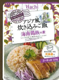
ワールドディッシュ アジア風炊き込みご飯 海南鶏飯の素