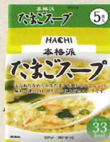
本格派 たまごスープ 5食