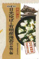
一杯の贅沢 日光ゆばと 有明産海苔の お吸い物