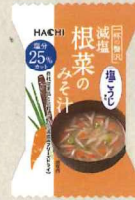
一杯の贅沢 減塩根菜のみそ汁 塩こうじ使用