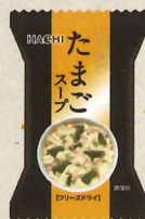
一杯の贅沢 たまごスープ