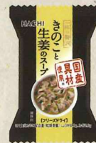
一杯の贅沢 きのこ生姜の スープ