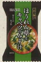
一杯の贅沢 ほうれん草と キャベツのみそ汁