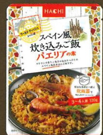
ワールドディッシュ スペイン風炊き込みご飯 パエリアの素