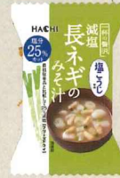
一杯の贅沢 減塩長ネギのみそ汁 塩こうじ使用