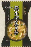
一杯の贅沢 長ネギのみそ汁