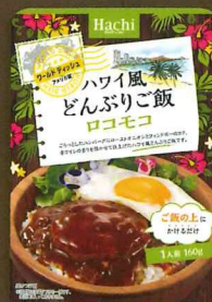
ワールドディッシュ ハワイ風どんぶりご飯 ロコモコ