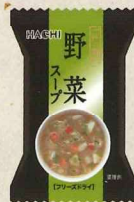
一杯の贅沢 野菜スープ