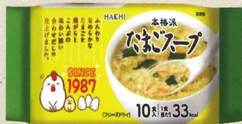
本格派 たまごスープ 10食