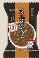
一杯の贅沢 オニオンスープ アルペンザルツ岩塩 使用