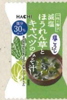
一杯の贅沢 減塩ほうれん草と キャベツのみそ汁 塩こうじ使用