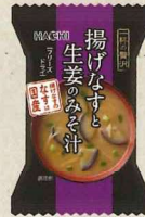
一杯の贅沢 揚げなすと 生姜のみそ汁